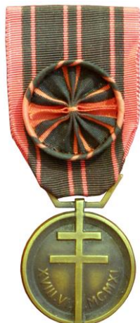
Medalla de la Resistencia francesa.

Esta ruta, que unía Francia con el Maestrazgo atravesando Aragón de punta a punta, fue de las que más tiempo se mantuvo activa porque se consideraba de las más seguras ya que discurría por zonas poco habitadas.