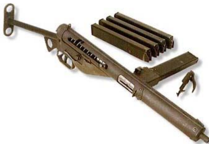
Subfusil Sten MK de origen británico muy utilizado por la guerrilla.